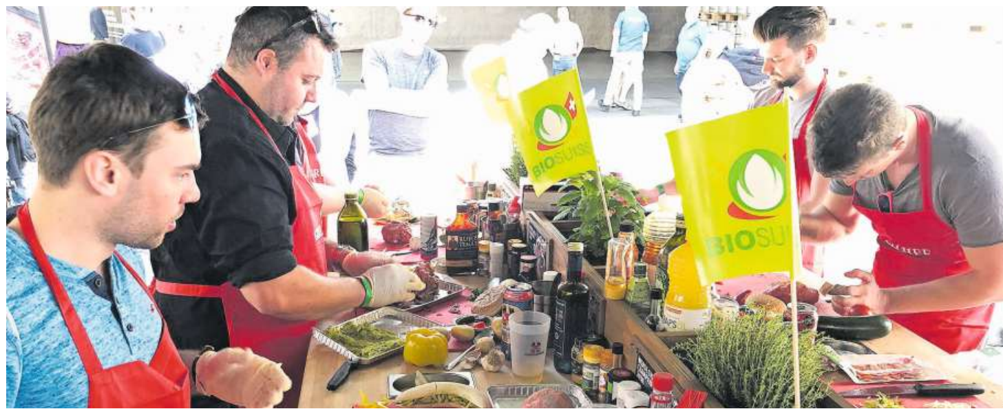
Schweizer Grill-Champion gesucht: Erstmals finden am Offa-Wochenende die Bell BBQ Single Masters statt.