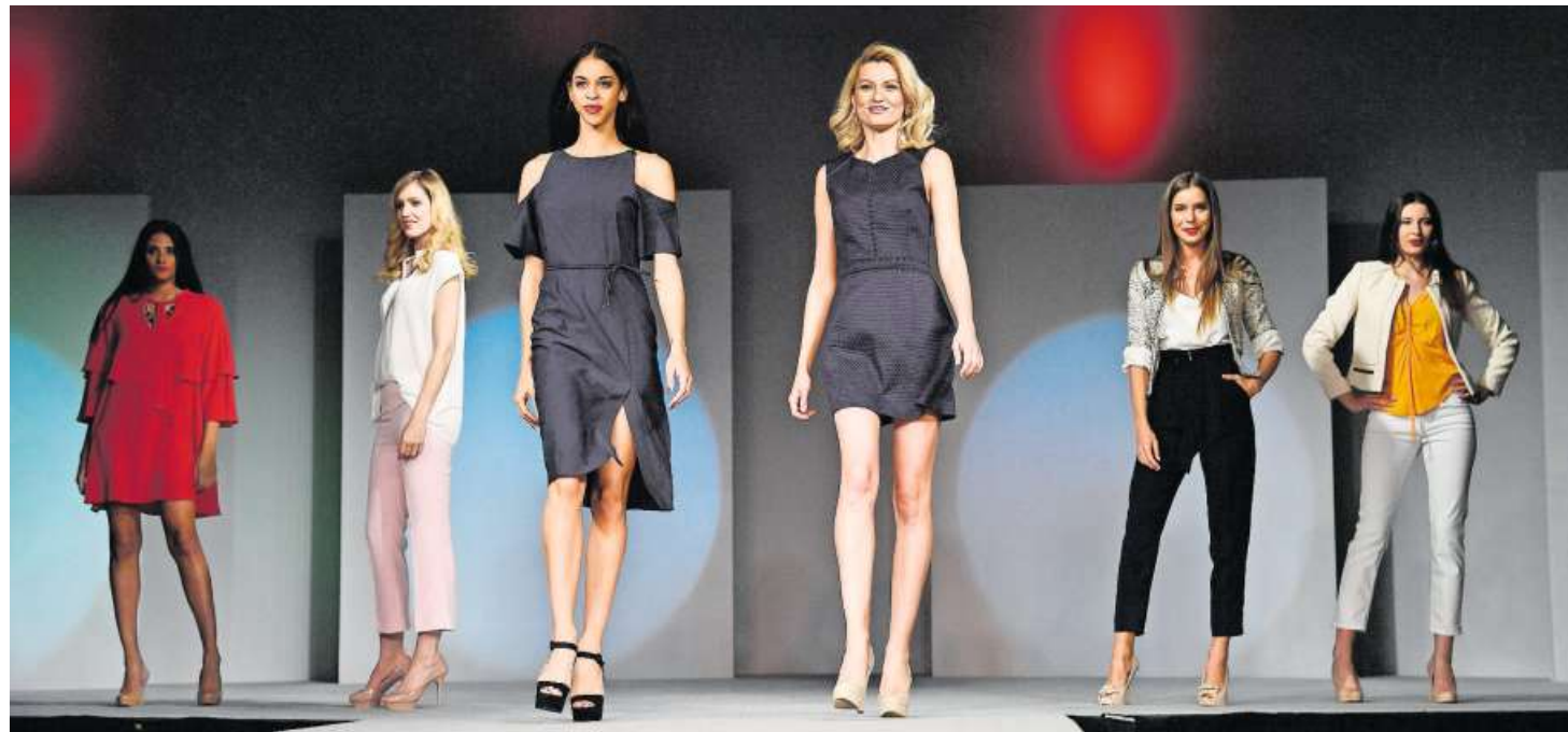
Die Offa-Modeschau zeigt täglich um 11, 13, 14.30 und 16 Uhr in der Halle 2.1 trendige Outfits für den Arbeitsalltag oder die Freizeit.