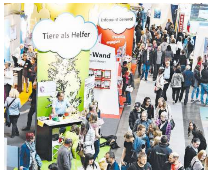
Rund um Freiwilligenarbeit dreht es sich am Benevol-Stand.

Sonderschau Die Fachstelle Benevol St. Gallen gibt in der Halle 9.1 Einblick ins Thema «Freiwilliches Engagement» in der Ostschweiz.