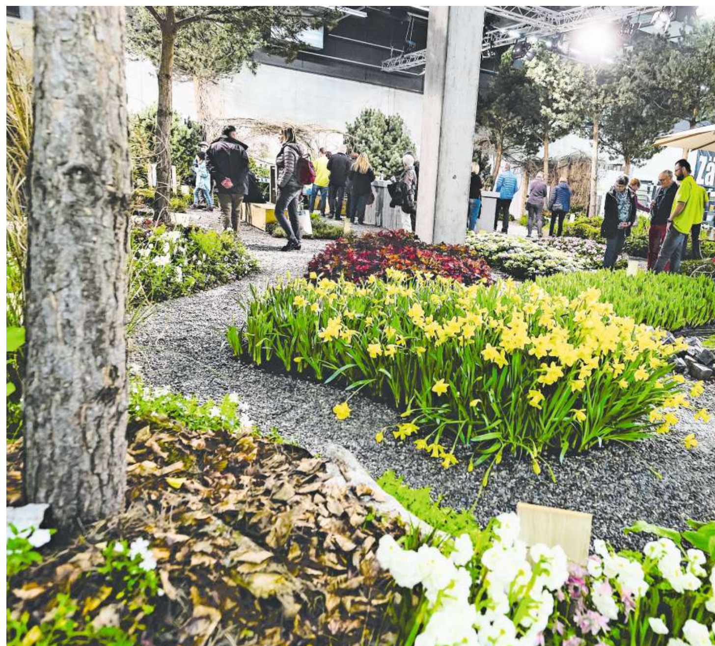
Von der Ernährung über Sport bis hin zu blühenden Gärten: Die Offa entführt in eine bunte, erlebnisreiche Themenwelt.

Rund ums Wohlfühlen, gesunde Ernährung und Bewegung dreht es sich in der Sonderschau «Preevent» unter dem Patronat